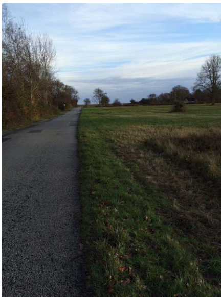
Figur 2. Placering af nyt fløjdige Set fra Nørreled ved matr. nr. 1b til havdige på matr. nr. 1f