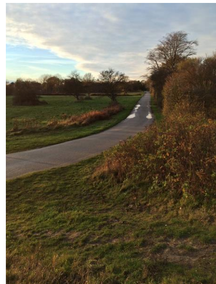
Figur 3. Placering af nyt fløjdige Set fra havdige på matr. nr. 1f mod Nørreled ved matr. nr. 1b