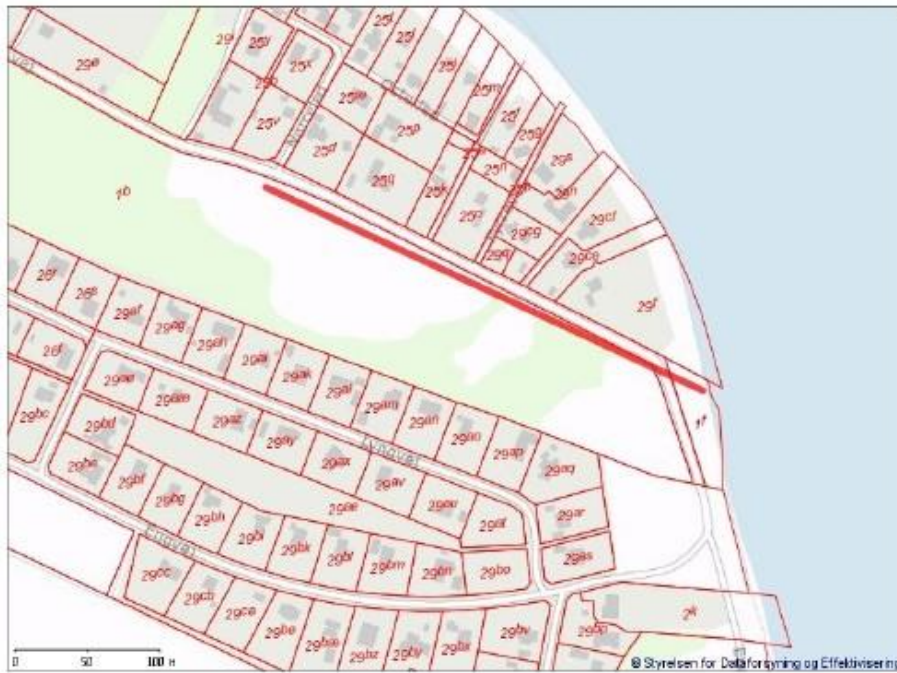
Figur 1. Udstrækning af nyt fløjdige.